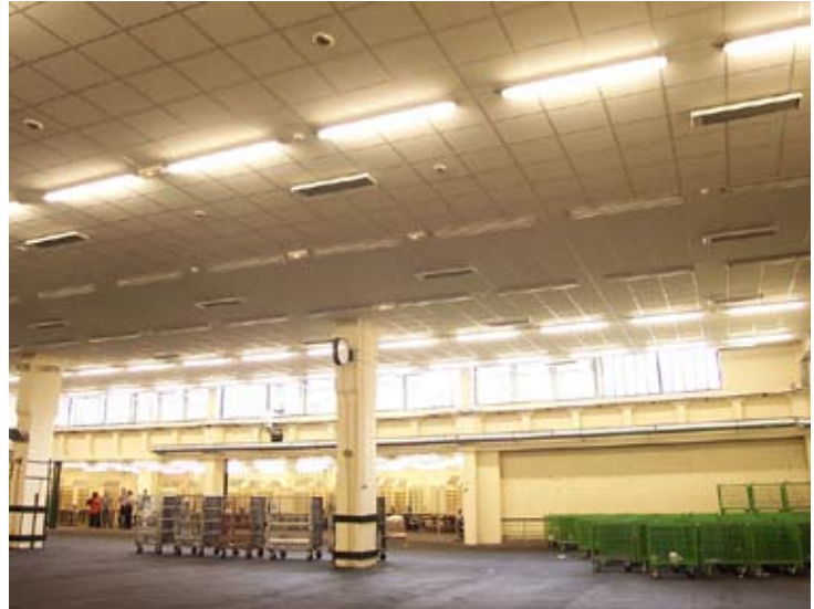
Los paneles radiantes dirigen el calor hacia las personas, el suelo y el mobiliario, proporcionando un alto grado de confort incluso en estancias muy grandes.