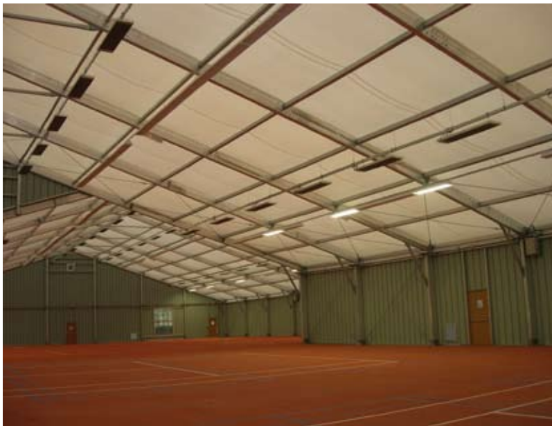
El EZ300 proporciona calor instantáneo sin precalentamiento, por lo que resulta ideal para edificios que no se utilizan con regularidad.