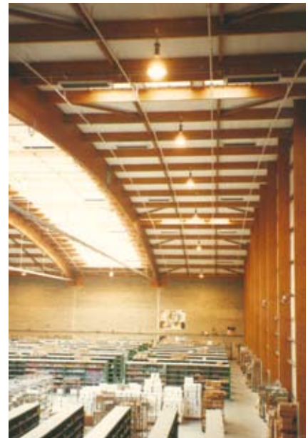
Los paneles radiantes son especialmente rentables en los edificios de techos altos, pues evitan las pérdidas de calor entre el panel y el suelo.