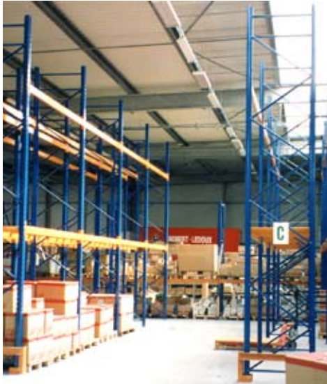
Dirigen el calor hacia la zona que más lo necesita.